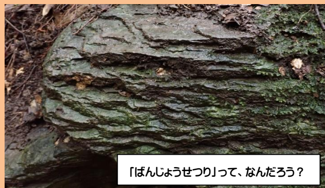
「ばんじょうせつり」って、なんだろう？